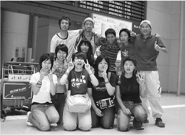
ネパールから帰国した藤原ゼミのメンバー（一番右端が筆者）

「日本にいたら感じるものが出来ないことばかりだった。日本では当たり前に行っていたことでも、ネパールでは当たり前ではなかった。当然だが行くまで感じるものが出来なかった。日本では『あって当たり前』のものがネパールには無かった。：