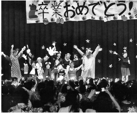
教員による出し物

全国的には、サークル活動など学生の自主的な活動が下火になる傾向にある状況で、本学では、例年七〇〜八〇%の加入率で、一人で複数所属している学生を含めると、百二十%というところでもな