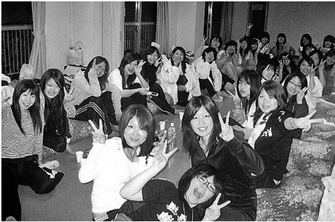
たてわり合宿の一コマ

事務局では、学生が相談しやすい窓口づくりに努めています。オープンカウンターやワンフロアで仕切りがなく、各部署が同じスペース内にあって連絡がとりやすいの