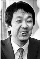
桜花学園大学保育学部学生課長を兼務し、現在に至る。

本題に入る前にまず本学の概要を紹介します。学科構成は、保育科、英語コミュニケーション学科、現代教養学科の三学科で、同じキャンパス内には、桜花学園大学保育学部(平成十四年設置)が併設されています。学生数は、短大が千名と四大が五百名の約千五百名になります。学生組織として、「学生会」があります。執行委員会の下に特別委員会として、「大学祭実行委員会」、「新入生歓迎実行委員会」、「卒業を祝う会実行委員会」の常設委員会があり、年間を通じて活動をしています。サークルは四〇前後あり、