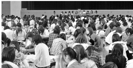
学生大会、前方は執行部

学生も、ゼミ・サークルの模擬店を中心に大変盛り上がっています。例年二日間で百八十店というように、ほとんどのゼミが参加します。日頃のゼミ活動における学生同士のつながりが希薄であれば、大学祭には参加しないと思います。もちろん最初から全員が盛り上がりつつあるわけでは