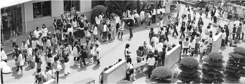
サークルの勧誘風景

四月当初のオリエンテーションはもちろんのこと、入学前オリエンテーションであるオープンキャンパスや各種入学試験においても、新歓委員会とタイアップしていろいろ取り組んでいます。具体的には、駅から大学までの道案内や受付・教室までの誘導、キャンパス内の施設案内、在学生として学生生活の紹介などを協力してもらっています。多くの大学のようには、アルバイト学生を雇って案内などをしてもらうところですが、本学では、このことが新歓委員会