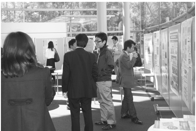
平成23年度新任教員研修のティーブレイク(2011年4月5日、野依記念学術交流館にて)