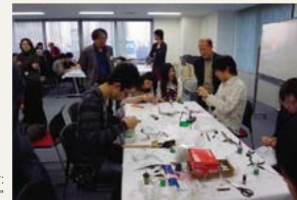
Science Experiment Instructor Seminar: "Production of Fuel Cells"

In order to popularize science among the general public, events are held in collaboration with faculty members of the four consortium universities. These events include seminars where experts exchange opinions on science literacy and science experiment instructor seminars where the general public and university faculty can dialogue through scientific experiments. These activities provide faculty members with an opportunity to enhance their teaching abilities as well as an occasion to exchange ideas and opinions on science education.