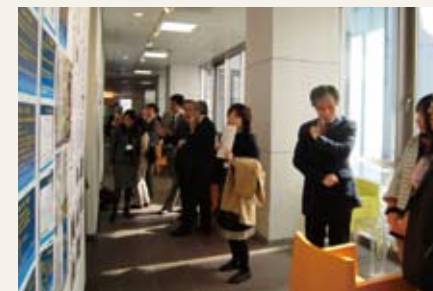
University Education Reform Forum in Tokai 2009