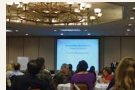
Attendance at 2008 POD Conference