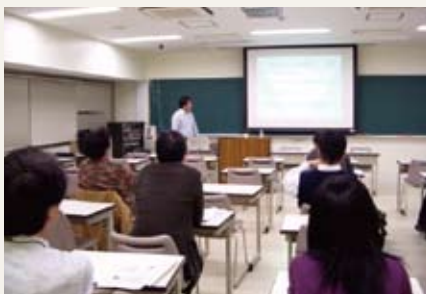
"How to Teach Critical Thinking"

Centered on faculty members who specialize in philosophy at the four consortium universities, as well as participants from neighboring universities, opportunities are created to discuss how to teach philosophy to undergraduate students not majoring in philosophy. On that occasion, faculty members, part-time lecturers and graduate students discuss how to improve philosophy classes.