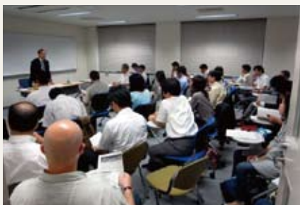
“Establishment of strategic management, and new roles and development of staff to promote strategic management”