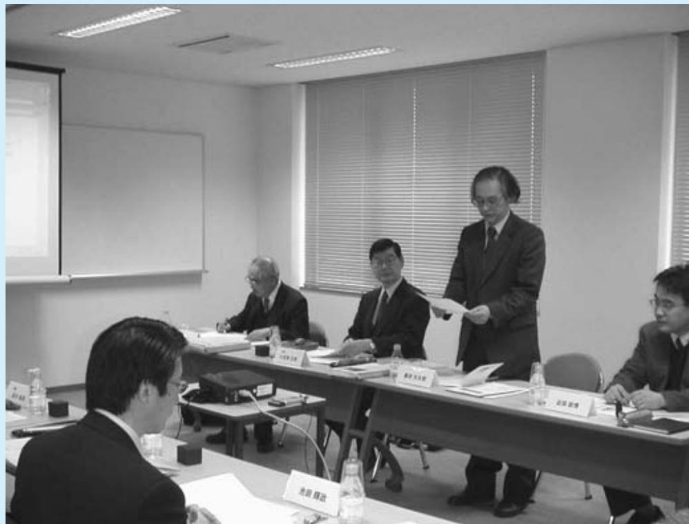
名古屋大学高等教育研究センター・ニュースレター