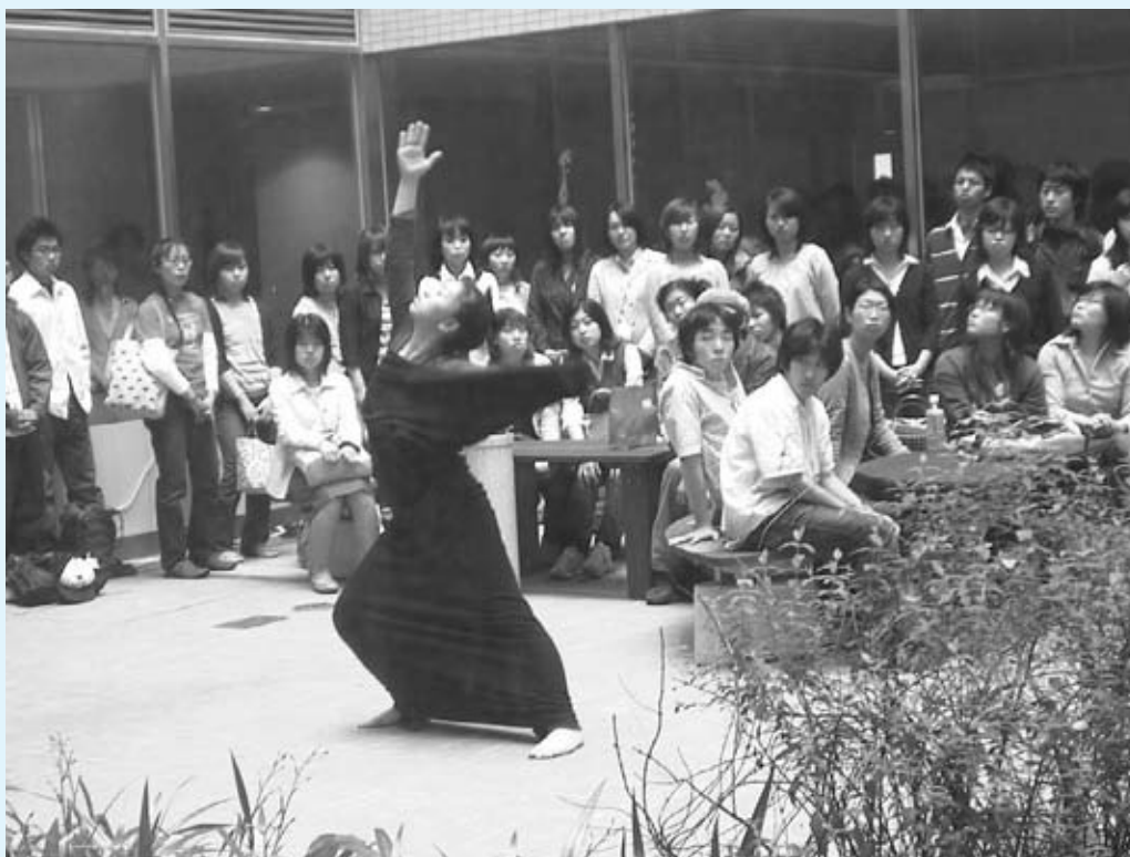
ゲストアーティストによるパフォーマンス《Center Live》

ファクトリーと名づけたアトリエで共同制作したポップアーティスト、アンディ・ウォーホルは、「僕がこんな風に描くのは、機械になりたいからなんだ」と言う。この驚くべき、そして矛盾に満ちた言説は、侵犯に身をゆだねながらも、なおかつアートがアートとしての存在している証とも受け取れる。戦場のなかで、アートに出会うこともまた、受講生たちに期待しているのだ。